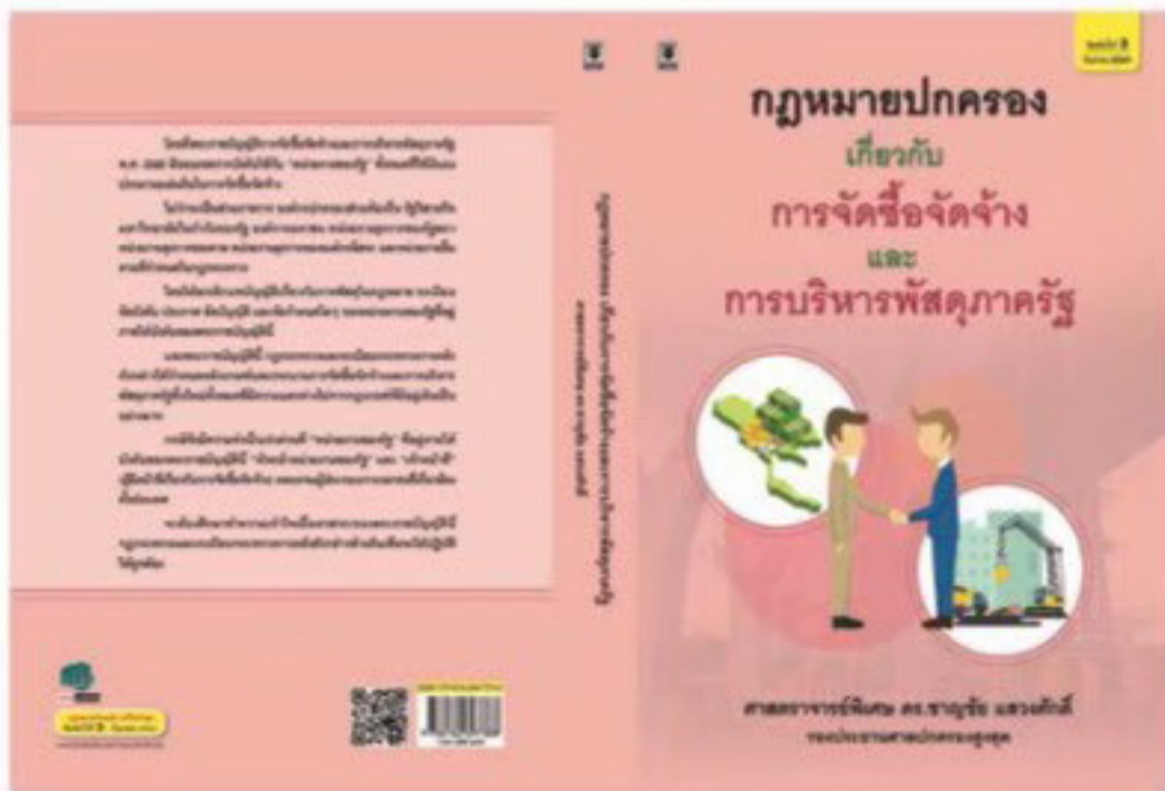
กฎหมายปกครองเกี่ยวกับการจัดซื้อจัดจ้าง และการบริหารพัสดุภาครัฐ ISBN : 978-616-269-738-8 ราคา 450 บาท