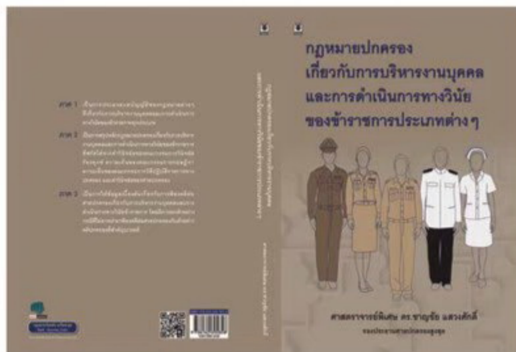
กฎหมายปกครองเกี่ยวกับการบริหารงานบุคคล และการดำเนินการทางวินัยของข้าราชการประเภทต่าง ๆ ISBN : 978-616-269-585-8 ราคา 500 บาท