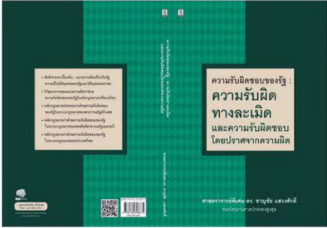
ความรับผิดชอบของรัฐ : ความรับผิด ทางละเมิดและความรับผิดชอบโดย ปราศจากความผิด ISBN : 978-616-269-867-5 ราคา 220 บาท