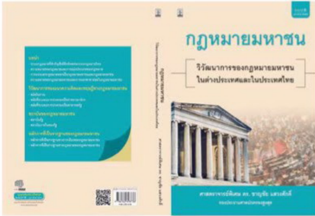
กฎหมายมหาชน : วิวัฒนาการของกฎหมายมหาชนในต่างประเทศและในประเทศไทย ISBN : 978-616-269-873-6 ราคา 420 บาท