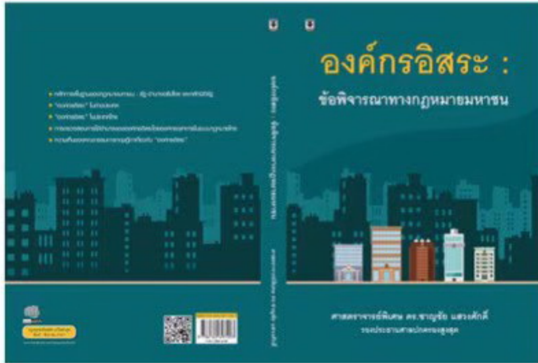
องค์กรอิสระ : ข้อพิจารณาทางกฎหมายมหาชน ISBN : 978-616-269-720-3 ราคา 280 บาท