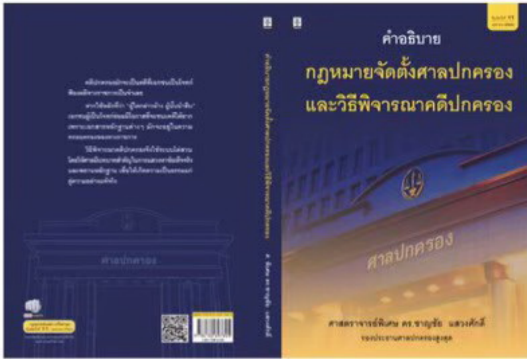
คำอธิบายกฎหมายจัดตั้งศาลปกครอง และวิธีพิจารณาคดีปกครอง ISBN : 978-616-269-784-5 ราคา 340 บาท