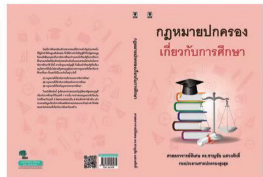
กฎหมายปกครองเกี่ยวกับการศึกษา ISBN : 978-616-269-627-5 ราคา 460 บาท