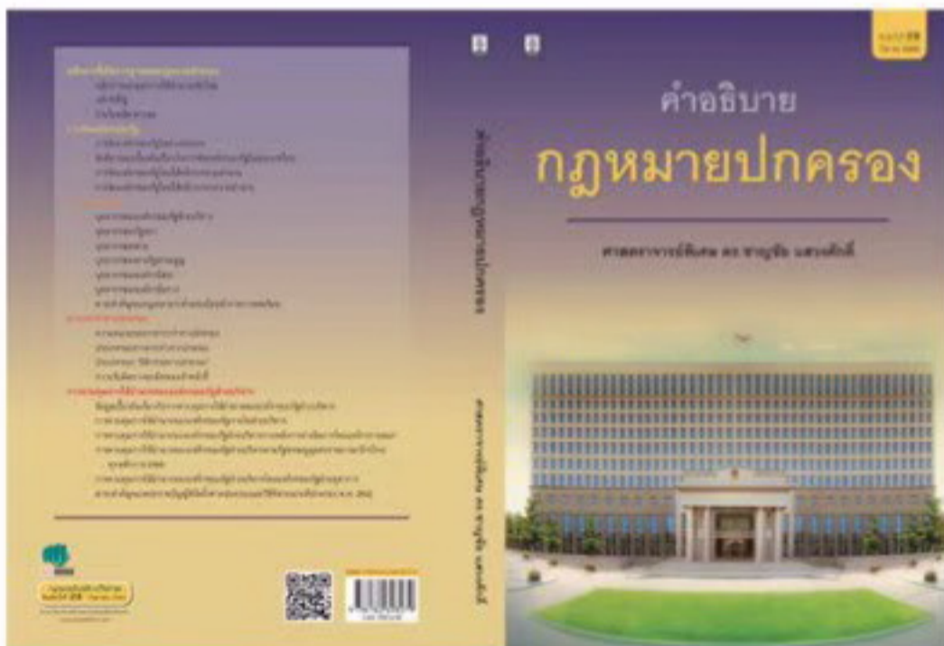
คำอธิบายกฎหมายปกครอง ISBN : 978-616-269-827-9 ราคา 320 บาท