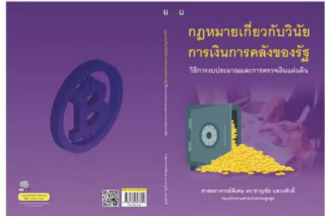
กฎหมายเกี่ยวกับวินัยการเงินการคลังของรัฐ วิธีการงบประมาณและการตรวจเงินแผ่นดิน ISBN : 978-616-269-760-9 ราคา 280 บาท