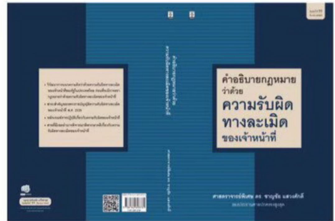
คำอธิบายกฎหมายว่าด้วยความรับผิด ทางละเมิดของเจ้าหน้าที่ ISBN : 978-616-269-878-1 ราคา 460 บาท