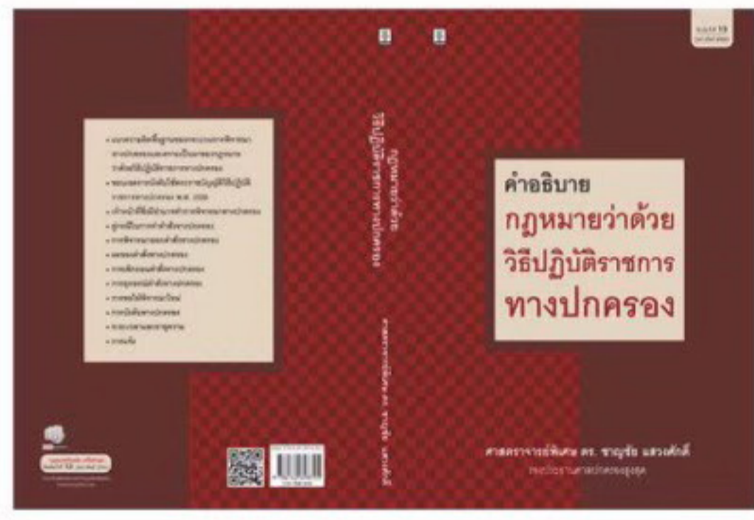
คำอธิบายกฎหมายว่าด้วยวิธีปฏิบัติราชการ ทางปกครอง ISBN : 978-616-269-870-5 ราคา 560 บาท