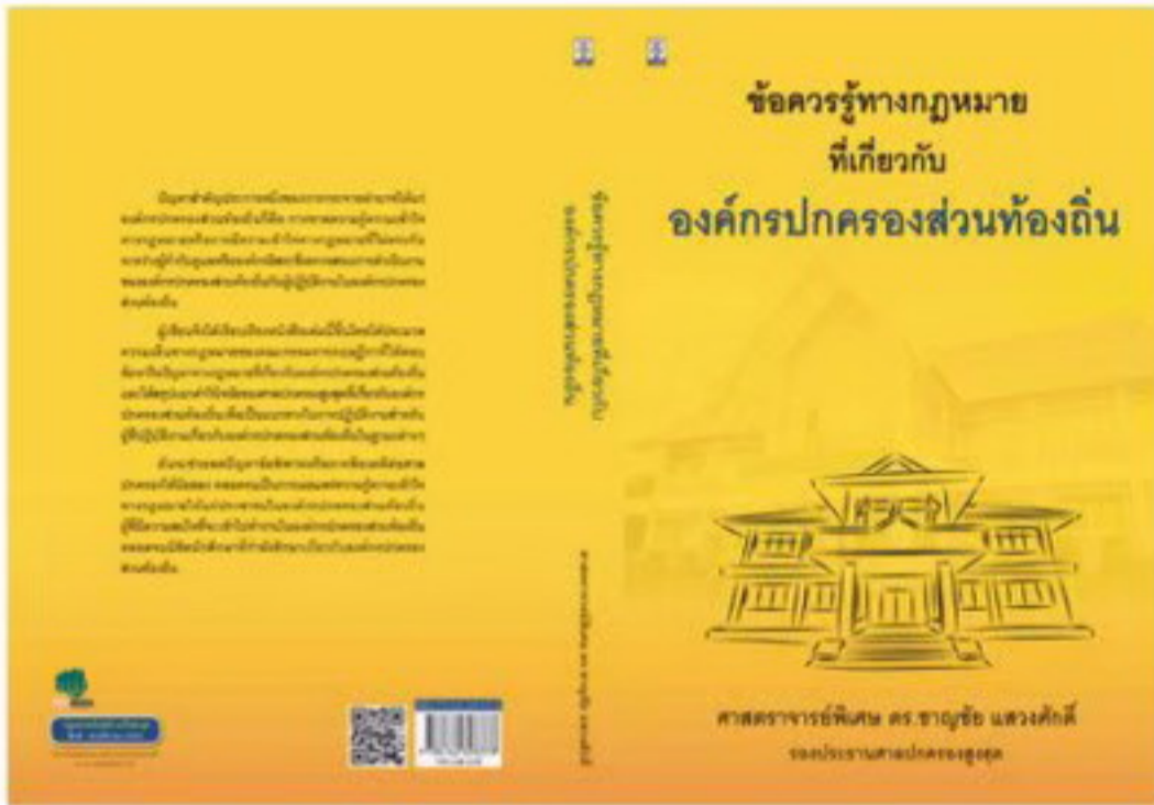
ข้อควรรู้ทางกฎหมายที่เกี่ยวกับ องค์กรปกครองส่วนท้องถิ่น ISBN : 978-616-269-837-8 ราคา 440 บาท