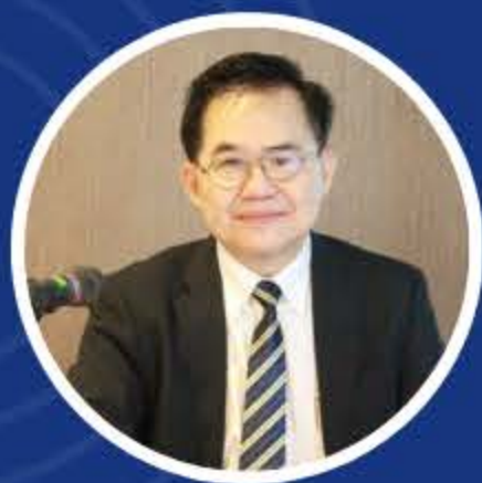
อนุชา สุนสวัสดิกุล ตุลาการศาลปกครองสูงสุด