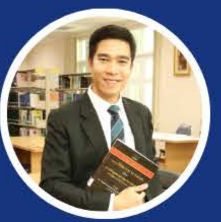
ชาญวิทย์ ชัยภันย์ ตุลาการศาลปกครองระยอง