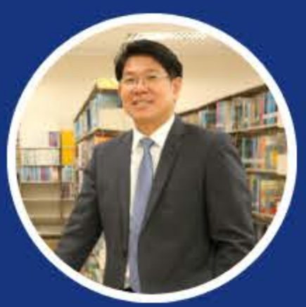
ชัยภัทร กัถกอง ตุลาการศาลปกครองระยอง